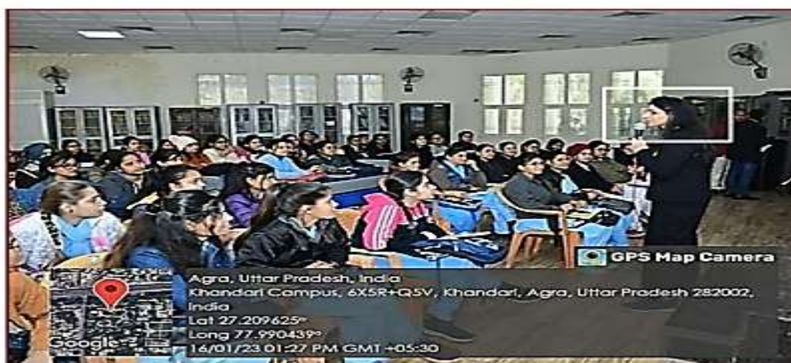
Workshop on "Smart Girl - to be Happy, to be Strong."

Beyond academics, the University actively organizes workshops, seminars, and awareness initiatives to strengthen gender sensitization and empowerment. Programs such as the workshop "Smart Girl – to be Happy, to be Strong".