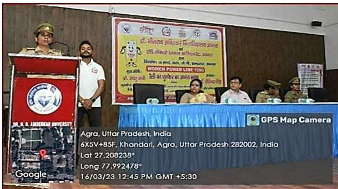
Seminar on “Women Power Line 1090”

(Cyber Awareness Seminar) enhance digital safety awareness. Collaborative programs such as “Women Power Line 1090” conducted with the Anti-Romeo Squad.