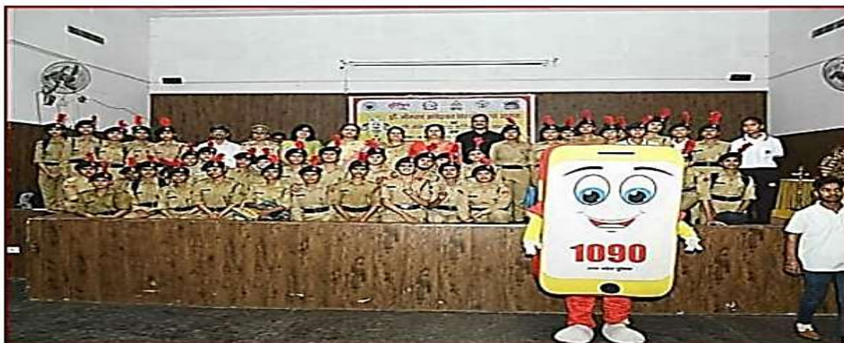
Seminar on 'Women Power Line 1090' in association with 'Anti Romio Squad'

( Women Safety Awareness Programme ) further ensure campus safety and legal awareness.